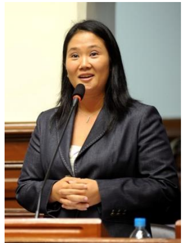
Keiko Fujimori, tegenstander van Pedro Castillo in de presidentsverkiezingen en dochter van voormalig president Alberto Fujimori.

De hele situatie ziet er niet rooskleurig uit. Toch hopen we dat alles goed komt en trachten we verder te helpen in Peru, al is het maar kleinschalig. Elke druppel telt. Zo hielpen we de laatste tijd bijvoorbeeld de organisatie FairPlay in Cuzco en de medische post in Aucayacu. Hopelijk kunnen we beide projecten blijven ondersteunen en dienen er zich zelfs nieuwe aan.