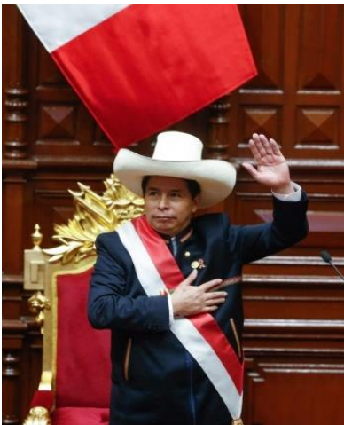
Pedro Castillo, de nieuw verkozen president.

In de regering die in augustus nieuw werd aangesteld, zitten ministers die vroegere banden hadden met het terrorisme of waartegen nog een gerechtelijk onderzoek loopt naar fraude. Het politieke gevecht en de zoektocht naar de waarheid over het verleden van de nieuwe ministers is nog volop aan de gang... en hot topic nummer 1 in de Peruaanse pers! De laatste jaren is het ene na het andere politieke schandaal aan het licht gekomen. De laatste 5 à 6 presidenten en/of waarnemend presidenten van Peru zijn of berecht, in verdenking gesteld of er loopt een gerechtelijk onderzoek tegen hen.